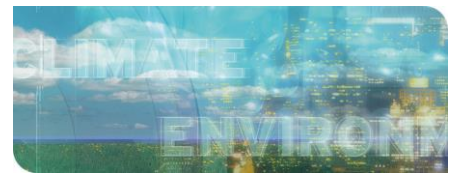
KIT-Zentrum Klima und Umwelt: Für eine lebenswerte Umwelt

Weltweit sind rund eine Million Pflanzen- und Tierarten vom Aussterben bedroht. Von der Biodiversität, zu der neben der Artenvielfalt